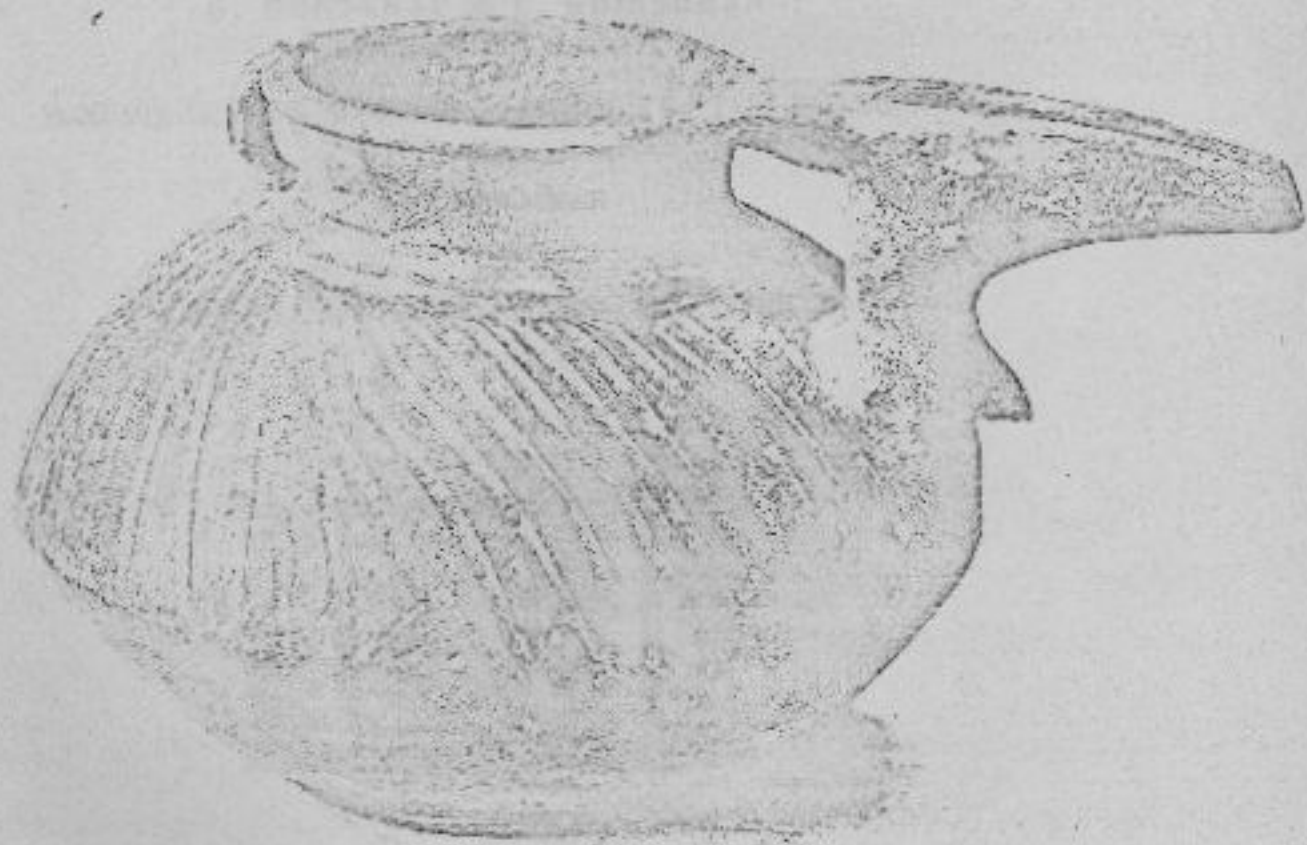
Céramique noire de Tépé Hissar (n° 1). Céramique noire de Ravennate (n° 2) (Musée du Louvre).